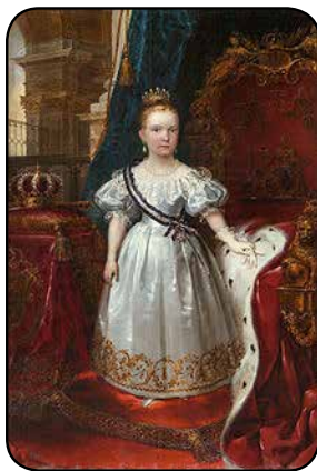
II In Isabel ume zala.

Orregaitik esaten eban Zelaia eta Ibarra ´tar Adrianek: “la verdad está sepultada bajo montañas de mentira” .