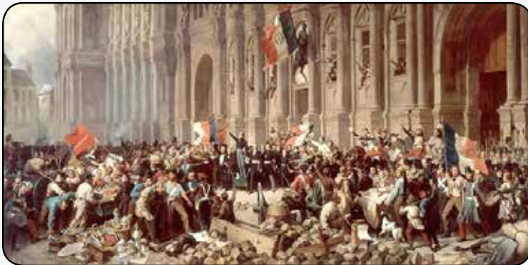
1.848ko urtean frantzezaren matxinadak.

1.851ko urtean Abenduaren 2an, konstituzio ori aldatzeko egoala eta batzarkidearen ezetza ikusi ondoren, laterizko matxintasun aundi bat antolatu eban, urte-egun onetan eroan ebana aurrera, frantzez lurraldeko toki arriskutsuak, guda mutillakaz artuta.