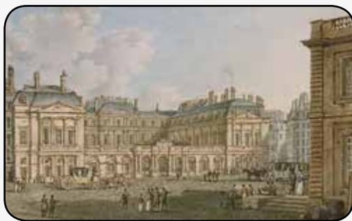
1.810eko urtean Royal Paris´eko Jauregia.

I Luis Felipe onen erregetza, bere aurreko errege Xn Karlosek, alosokerizko erregearena jaurri ebana baiño, frantzezaren konstituzio barriko erregetzarena jaurri eban.