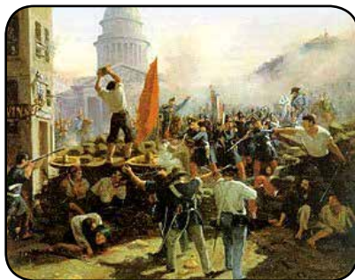
1.848ko urtean Pariseko kupel matxintasuna.

Ia bi illabete eskas edo laburretan gizon oneik, Frantziko lurraldean politika arloari, iñoz emon jakon aurrerakuntza emon eutsoen. “Gizarte edo ta Demokraziaren Errepublika” ko lez deituta batzorde oneri.