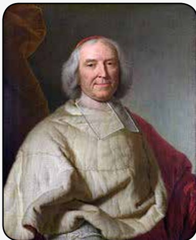
Andre Erkule Fleury kardinala

XIVn Luisen azken nai bidetik Orleanseko II In Felipek Borboneko dukea il zanean, Andre Erkule Fleury kardinala izendatu eban XVn Luisen irakasle lez, 1.726ko urterarte egonda beragaz.