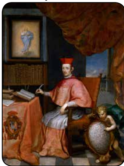
1.674ko urtean, Alonso del Arkok egineko Nithard Eberardotar Juan kardinalaren argazkia.

Uste osoa euki eban Austriako Mariana erregiñ onek Nitard kardinal onekin, aintatek, bere baliadun bakarra zala esan arte, gorteko aolkularitzan, ia agintaritzazko arlo geienak artuta eukazalako bere ardurapean.