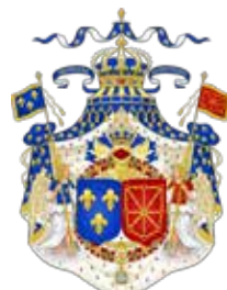
XIII In Luisen armaria