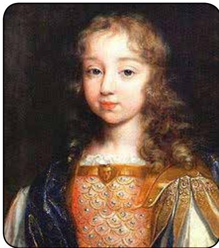
XIVn Luis bere aurtzarora Frantziko erregetzaren ondorengoa

Orregaitik bateatu eben Dieudonneko izenarekin, “Jaungikuak emondakoa” esan gura dauelako.