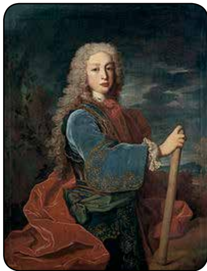
I Luisen margozkia

I Luis, Vn Feliiperen seme au, Orleanseko Luisa Isabelekin egon zan ezkontuta, Igo Luisek baiño urte bi gitxiago eukinda.