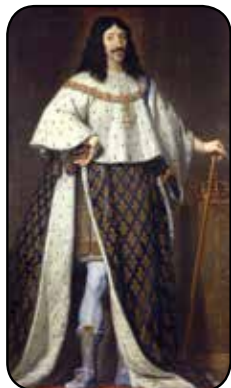
Nafarrokoa Una eta Frantziako errege XIII In Luis eta Andorrako Printze kidea.

1.641eko urtean ta Kataluña matxinatu ostean, Frantziaren babespean geratu zan Andorrako printzerria, eta XIII In Luis izendatu eben Bartzelonako kondea.