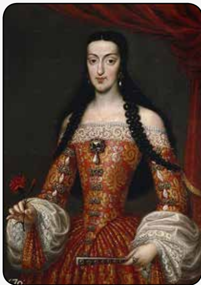
Orleanseko María Luisa, IIIn Karlosen emaztea.

1.689ko urtean il zan Orleanseko María Luisa, IIIn Karlos erregea, itxusgarri edo apalgarri (1) itzita.