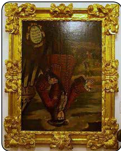
Jatibako Almudiñen, Vn Feliperen margozkia buruz bera, 1.707ko urtean erria, erretzea agindu ebalako

Gero VIIIn Fernandogaz, ondorezko gudak edo karlistadak deituteko gudak eka- rriko ebazanak.