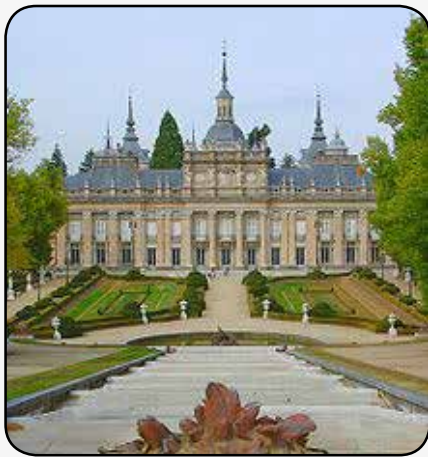
Vn Felipek aginduta, San Ildelfonso ren errege jauretxea. Bera eizan joaten zanean, eguras-etxe lez eukiten ebana.

Baita Italiar eragipen aundia be euki eban Vn Felipeen erregetzak, bere emazte Farnesiotar Isabellek euki eban nortasun sendoaren bidetik.