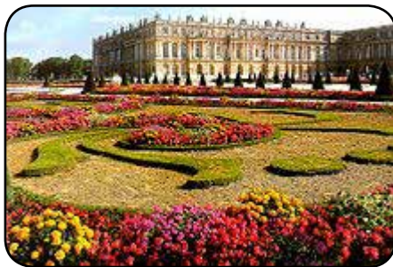
XIVn Luisek egin eban Bersalleseko jauretxea.

1.680ko urtearen amarkadan, Europako lurraldean ta XIVn Luisen aginpean, Frantziak artuko eban eragipenezko indarra, aundia izan zan.