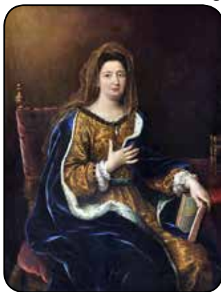
Maintenon 'tar Madame, XIVn Luisen bigarren emaztea.

1.683ko urtean il zan Maria Teresa, XIVn Luis erregearen emaztea.