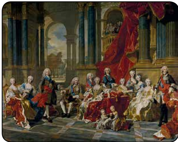
Vn Felipe bere bigarren emazte Farnesio´tar Isabelekin, euki zituzen alaba Semeakaz.

Eta bere eriotzaren aste oso bat bete barik oraindiño egonaz, bere seme VIn Fernando erregeak, ama ordea Farnesio´tar Isabel Erretiroko jauretzetik atara ta, Osunako dukesaren Jauregui-etxera bialdu eban, bere seme Luis ta Maria Biktoria alabeagaz batera, ia amabost urteetan bera ta bere anaiarrebak Asturiaseko printzeak izanda edo izateagaitik, zigortuta lez euki ebazalako.