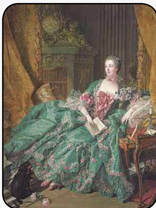
Ponpadourreko Markesa ta Duke Andrea.

Duke-andrea be izendatu eban Luisek, eskubidea emonda erregeñaren ondoan ezartzeko, Ponpadourreko Markesa orrek sekula ez eban erabili eskubide ori, erregeñagaitik begirun aundia euki ebalako.