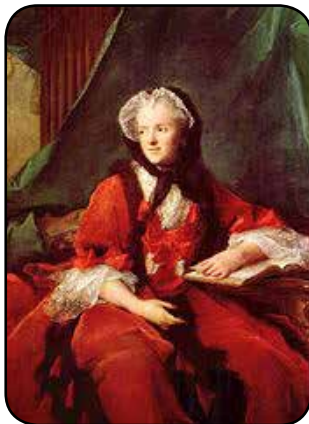
María Leszkzyńska, Poloniatik Frantzira etorritako erregeña

Maria onek, errege leiñuetatik etorri arren, ez eban euki dirurik, baiña naiko elduta egoan, Frantziko erregetzari ondorengo bat ekarteko.