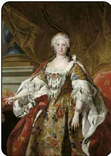
Farnesio´tar Isabelen margozia Madrilleko Prado erakustokian dagoena.

Arazo orregaz, atzerrirako politikaren aldaketazko bearkuntzan agertu zan, baruan sortu jakon antzera.