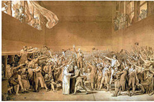
Orduko Frantzez Aberri Batzarra

Frantziko iraultza, errigizartearen jaurkintzarako bear ziran lege ta tresnerizko izan gaitasunak, euren almenezko asken mugaraiño eldu ziralako asi zan, errigizartearen bizitza, politikazko arazo andi baten biurtuz .