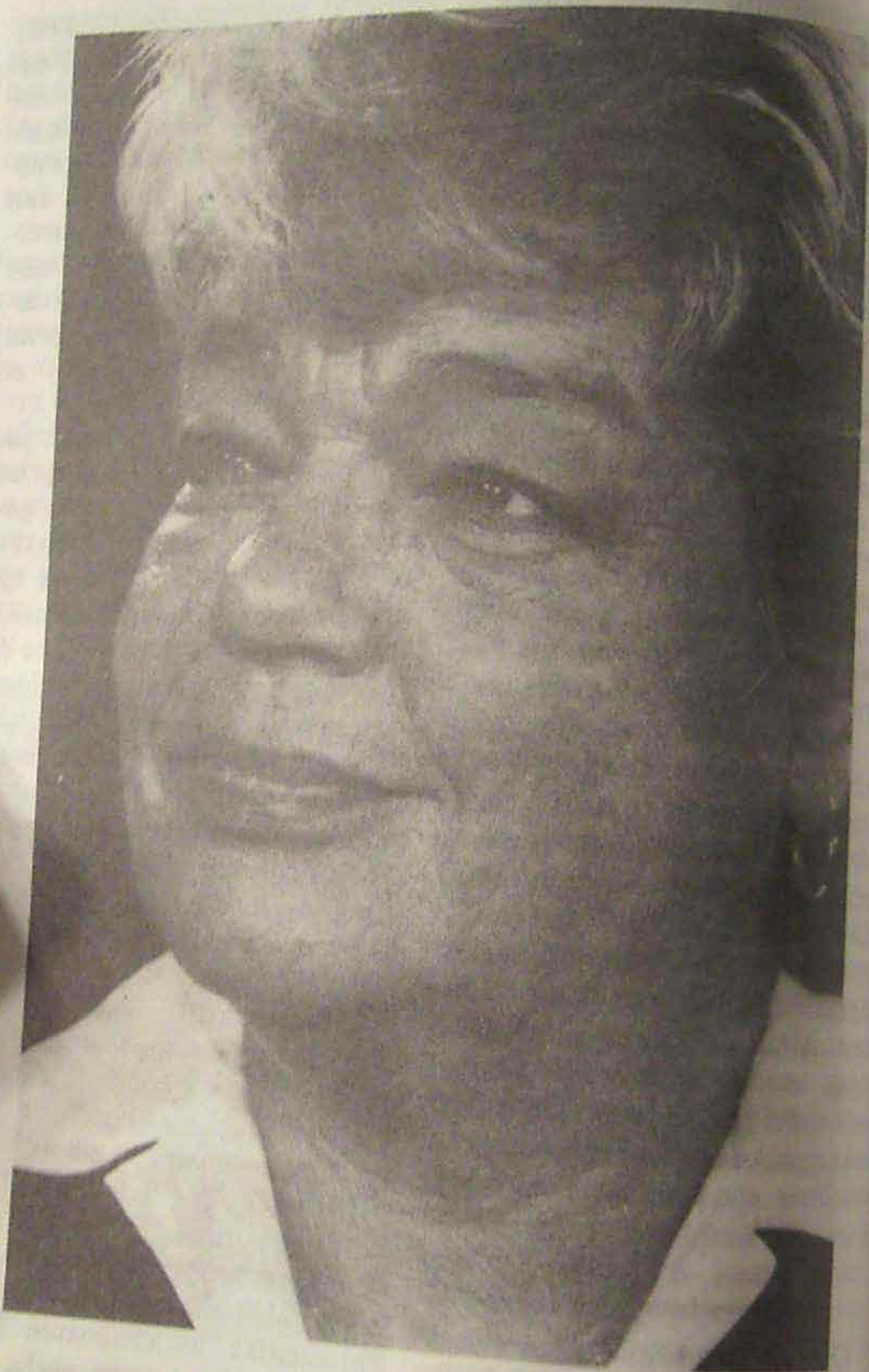
Urteetan aurrera joandakoan