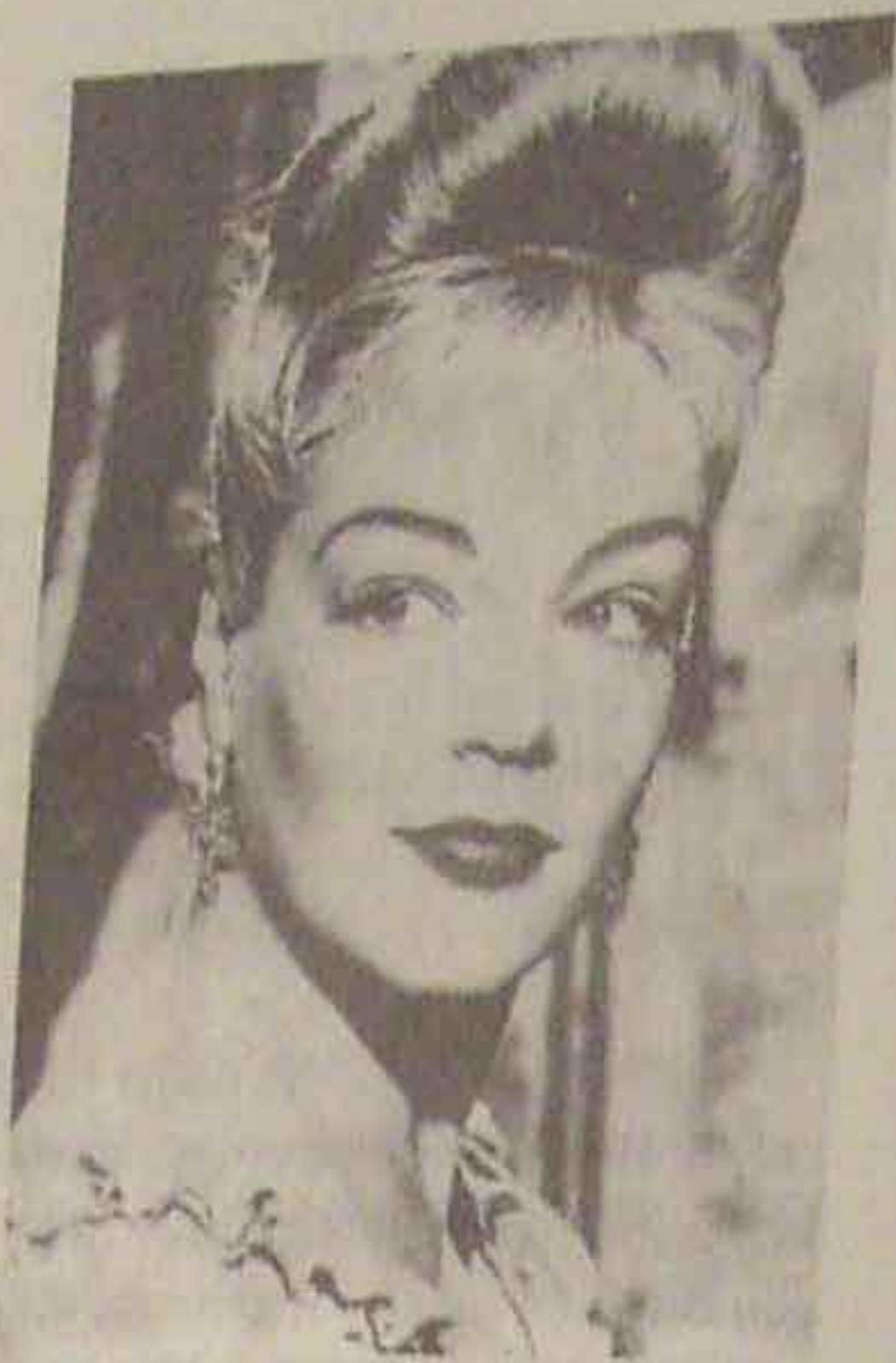
1951'an Casque d'Or paperean

eder; etzan alan be, egundo, izar- -lillura lainotan ito. Ekintzari emona nainoiz geunkan Simone gerty ta prest arriskuan jarteko, bere utsegite ta makurrak ezagu- tzeko, bere etsimendu ta galpenai egokien balioa ezarteko. Zentzun eta kemen garrantzizkoz jantzia zan.