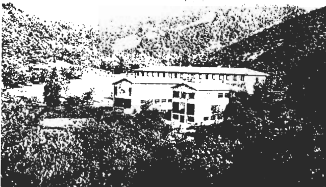
Antxiñako inguru zoragarrian, gaurko tankeraz eregitako ostatua.

Basorantza, zugatz-artean, maiak. Oneik ostaturako dirurik ez dauken eta izadiagaz artu emonetan urrago bizi nai danentzat.