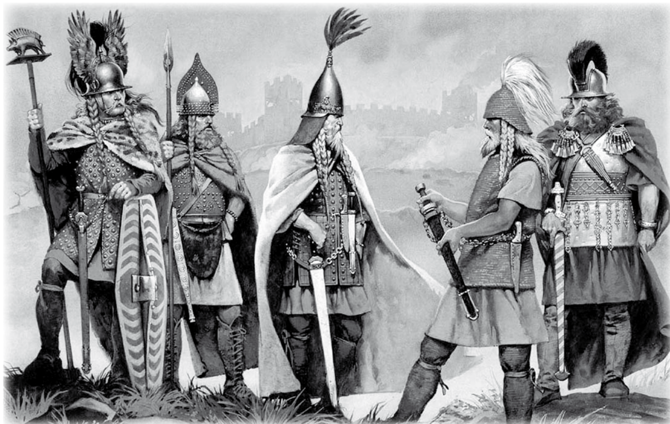
(2) K.a. 753an. (1) Ekialdetik ibilita eta Ititaren jendekuntzatik artuta, itzulkeran, eurak ekarri eben burdiñaren ezauntza. (2) Hallstatt = burdiñaldiaren jendekuntzazko lekua, 2.000 ilobi baiño geiago aurkitu zan lekua eta gatzaren meaztegiak. (3) Jendekuntza = civilizaciòn.

K.a. 900-500 urte bitartean, burdiñezko asieran (1) , Austriako Iparraldean Hallstatter ur geldi inguruan, Hallstatt (2) burdiñaren jendekuntzazko (3) tokian eta Alemaniaren Ego aldean Renaniako lurraldeetan kokatuta egon ziranean, Keltiarren giza Europaren Sarkaldetik zabaltzeko atondu edo prestatzen asi zan.