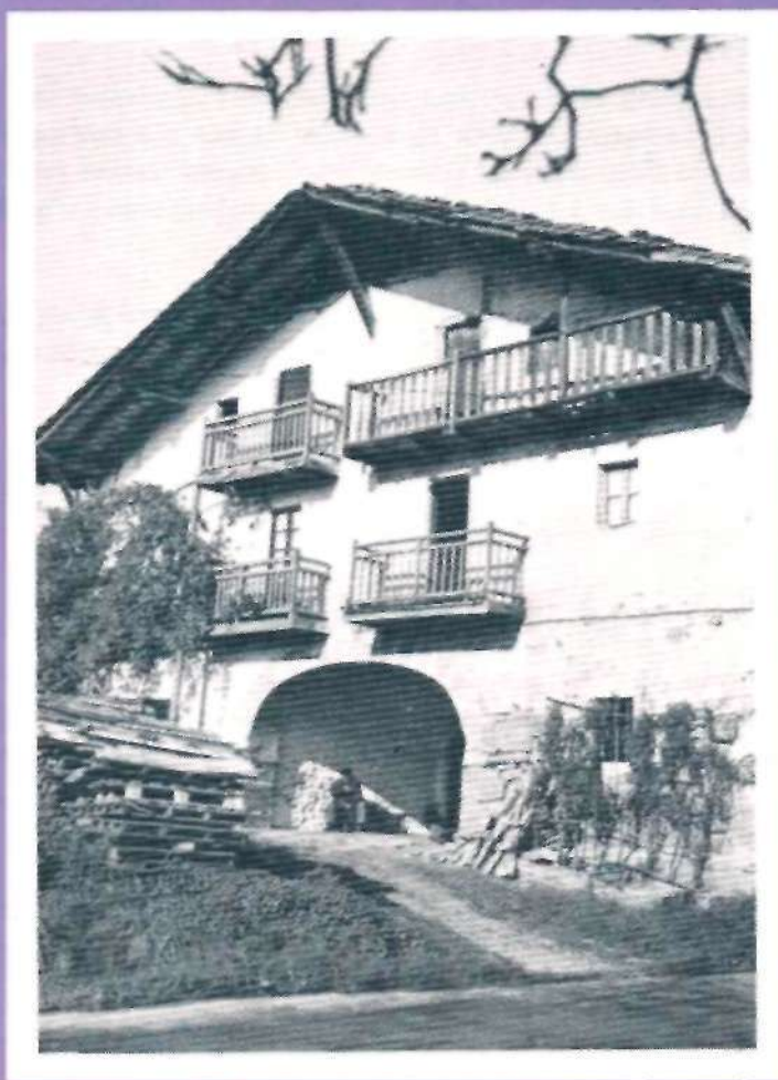
BASERRIA EUSKEREAREN ITURRIA

BIZKAITARRAI-BIZKAIERAZ* 102n. Zenbakia Azilla/Zemendia 1986