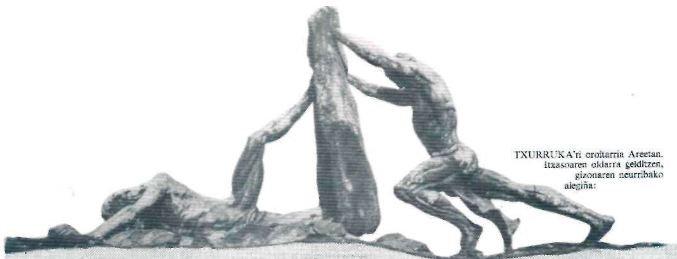
TXURRUKA'ri oroitarria Areetan. Itxasoaren oldarra gelditzen, gizonaren neurribako alegiña: