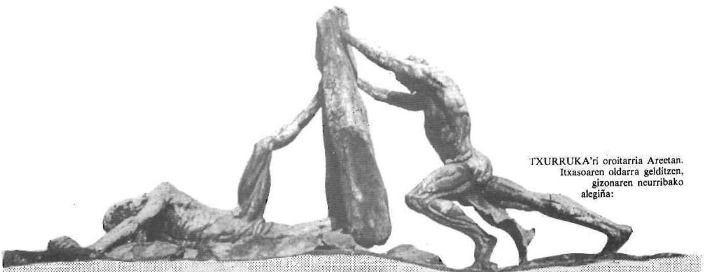
TXURRUKA'ri oroitarria Areetan. Itxasoaren oldarra gelditzen, gizonaren neurribako alegiña: