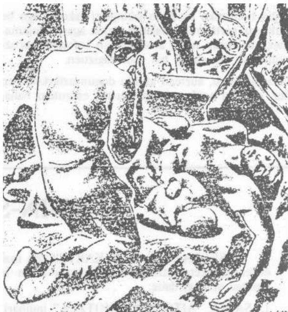
"Gernika" A. ARTETA'ren LALIKIA

Jorraillak 26. Bonbaketaren 50n. urte-eguna Gernika'n. 10'etan illerrian, bonbaketan ildakoen oroimenez oroitari bat jarri zan. Gero Meza Nagusi ederra, Gernika'ko Koralak abestua, egun baltz negargarri aretan idakoen aide. Jaurlaritza ta beste agintariak bertan eta gero batzarretxean.