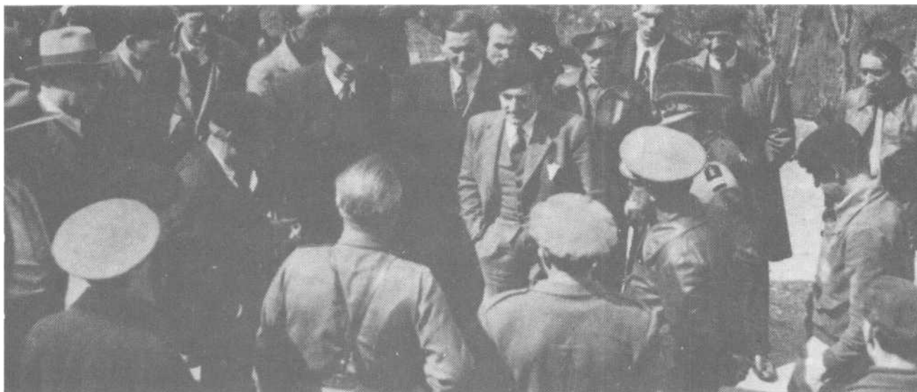
Lerida'ko frentean 142 Brigada Mixta Vasco-Pirenaika'koekin.