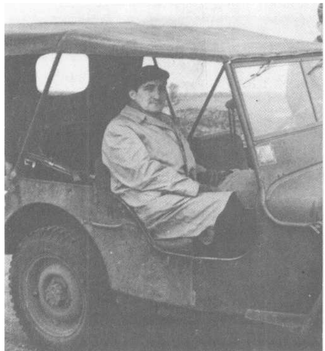
Paris-inguruan 1945. Ifar-Ameriketako gudariak gazte euskaldunak gudarako prestatzen ari ziren garaikoa.

Jose Antonio'ren Gabonetako Mezuaren zai egon oi zan Euskadi osoa. Urteero eman oi zuan bgre itxa-