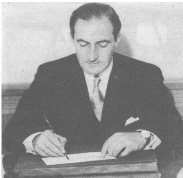
Jose Antonio Aguirre Euzkadiko Lenengo Lendakaria.

Estella'ko Estatutoaren billa gebiltzala, Iruñan Mola militarra jeiki zan Errepublikaren aurka, 20.000 napar karlista berekin zituela, Uztailaren emeretzian, 1936'garren urtean. Egun artan zan Beasain'go Batzokiaren asiera