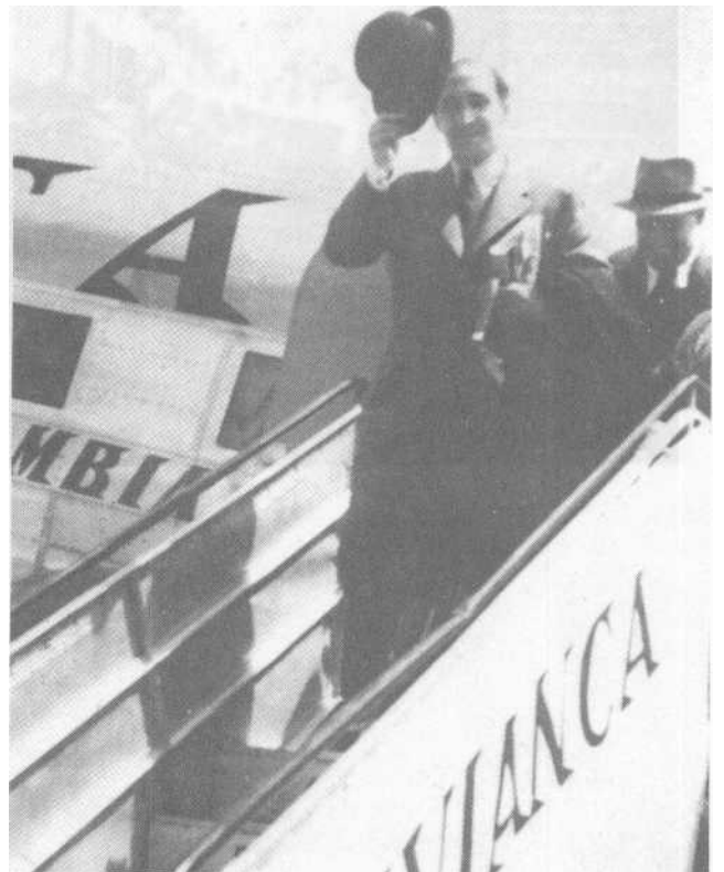
1942. Bogota'ra eldu zanean Ego-Ameriketan Euzkadi'ren mezua zabaltzera.

Bilbaon jaio zan Martxoaren 6'ean 1904'garren urtean eta Paris'eko Passy auzoan il zitzaiGUN , biotzekoak emanda, Martxoaren 22'an 1960'garren urtean. Doniane Loitzun'era ekarri zuten, eta 28'aren eguerdi-eguerdian, Jose Antonio'ren zerraldo gaiñean, ziñ egin zuan Leizaola jaunak, Euzkadi'ko Bigarren Lendakari bezala.