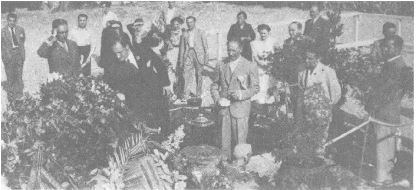
Companys eta Irujo lagun dituela Frances Macia katalan abertzalearen omenez. Otsaila, 1939.

Doistarren erasoia Europa guztian zear. Endaia'raiño eldu ziran. Bien bitartean, Jose Antonio Europa orretan igesi batetik bestera Berlin'eraíño. An izena aldatu, Jose Andres Alvarez Lastra Jose Antonio Aguirre Leku-be'ren ordeaz, eta Panama'ko pasaportearekin Ameriketara iges.