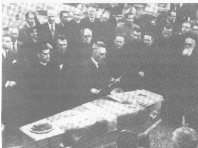
Donibane Loitzun 'en eortzia. Bere gorpuren gainean zin egin zuan Leizaola Lendakari berriak eguerdiko 12'etan, Martxoak 28. 1960.