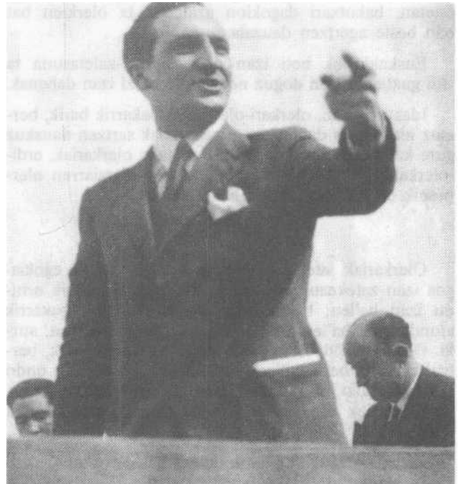
Eibar'en mitiña ematen 1933'an.