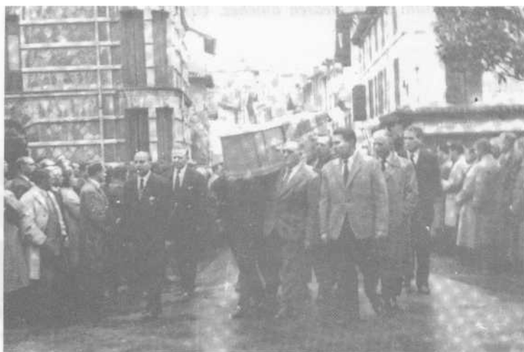
Paris'ko Passy auzoan illa 1960'garren Martxoa 22.