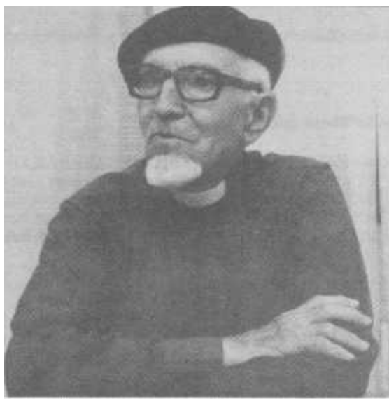
Uriarte ta iza'tar Kepa aita, frantzisko'tar euskaldun abertzalea, gudarien kapellau izana, lur santutik igon dau aitaren etxera, betiko Jerusalem'era.