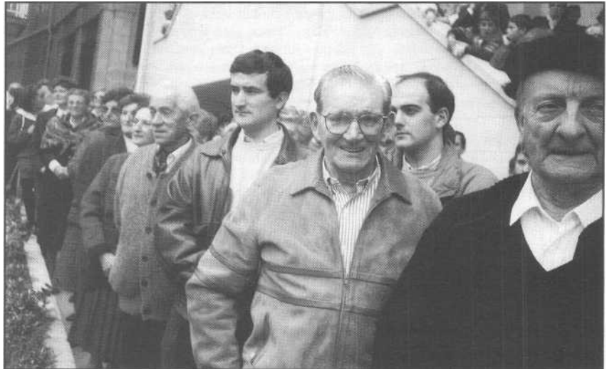
Euskerazaleak eun Euskerawint:ako lankide batzuk omenaldian, beste senide, adiskide ta ondarrutar askogaz.

Ez da nekagaitza, ezta aspergarria be, bere prosa arina, ondo tajutua, Augustinek idatzitako ainbat eta ainbat orrialdetan zear nabarmentzen jakuna.