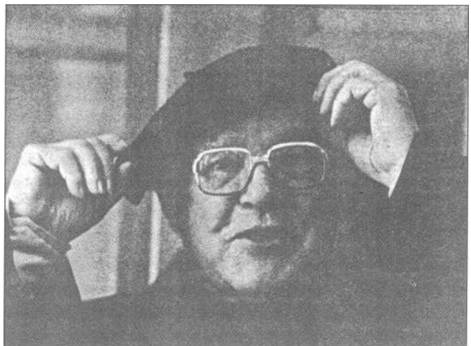
Aita Sunti'k txupelu uizkor ipinten dau.

Jarraian doaz "AITA SANTI" ta "AMOROTO'ren" alde abestu ebezan izki ta erestitzak: