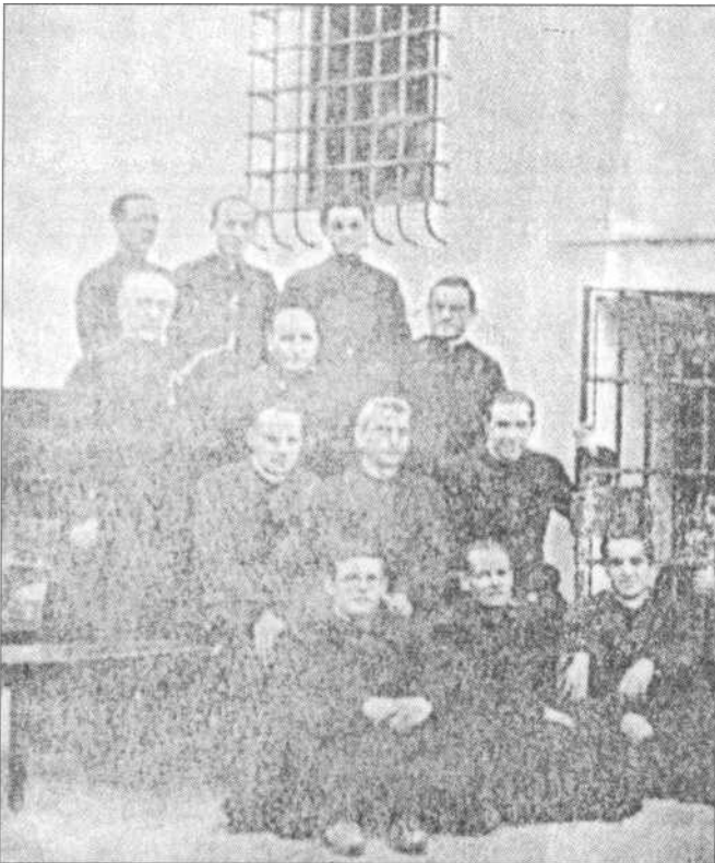
Karmoara (1940). 12 apaiz, espetxeko larrin itxian. Ni lenengo, azpiko leen-lerroan.