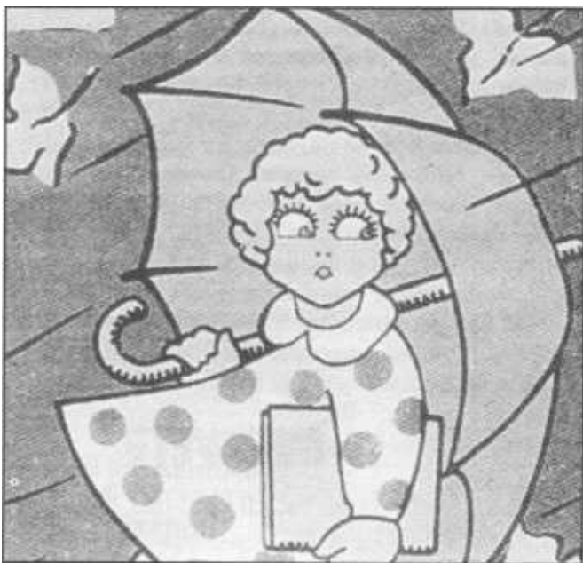
1931 -11, iku.rtuluko esku-liburu baten tiza/a, Gero gerokoak'

Eta beste au be gogoratu bear dogu: Jaiotzen zerrenda ekarren liburuetan, nik Bilbao'koetan ori ikusi egin dot, euskeraz idatzita egozan izenak Franco'ren aginduz kendu egin zirala eta ordezkokiezan erderazkoak ipiñi zirala. Franco'tarrak euskereari eutsoen gorrotoa eta ezarten eutsoen zapalkuntza oso nabarmena zan.