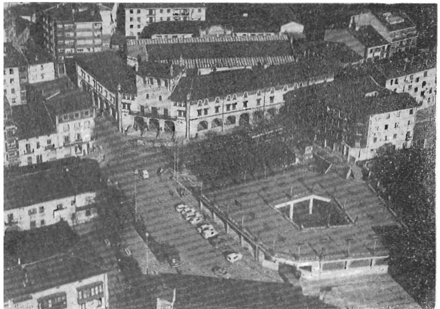
Mungia'ren uriburua barriztua: Erdian udaletxea, eskoian eta berebillen aurrean Azoka-leku barria, gainean here ibiltoki ederra.

«Concordia» kalea ez da estua, baiña ondo betetan da egun orretan. Eta arira datorren ezkerro,