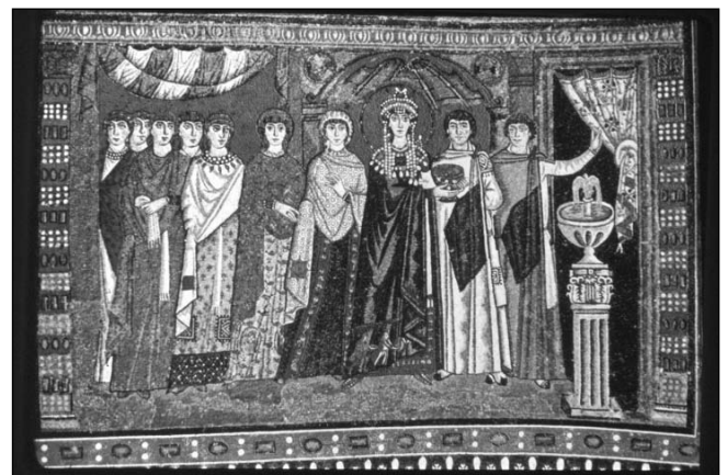
Teodora ta Bere ingurukoak: Mosaikoa

Euren erder-bidea zabaldu eben Eslaboen artera ta Armenia'ra