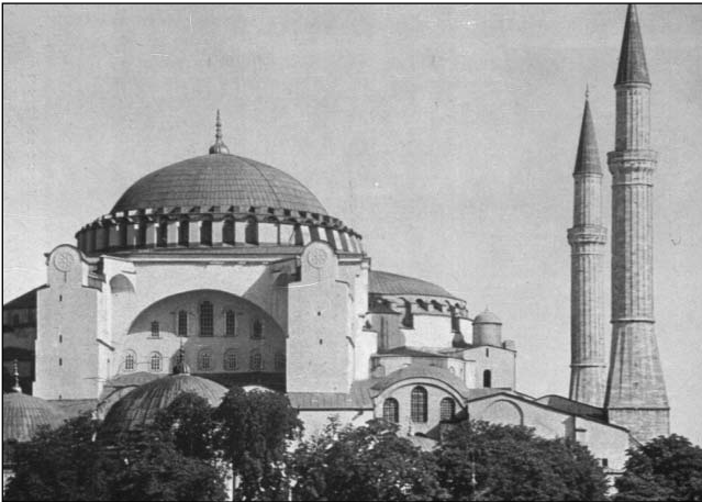
Santa Sofia Eleizea. Konstantinopla'n

Lanik ederrenak VI gizaldian agertzen dira Justiniano'ren aldian. Esaterako Santa Sofia.