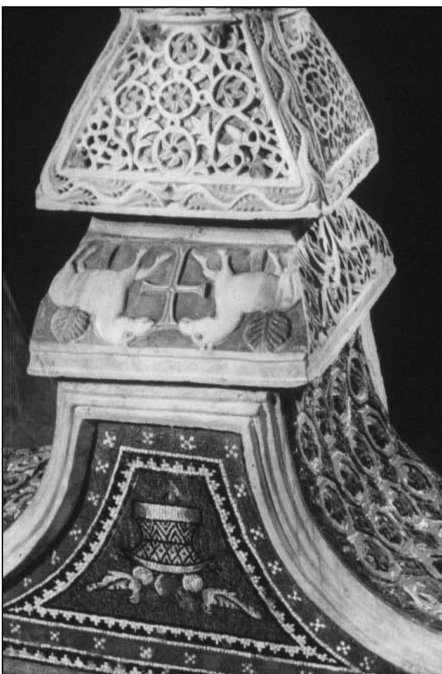
Bizantzio-Tankekarako kapiela: azpian landarak, gainaen txuntur-erdia edo "zima-zio" buruz bera.

Rusia'ra be zabaldu zan euren etxegintza X gizaldian.