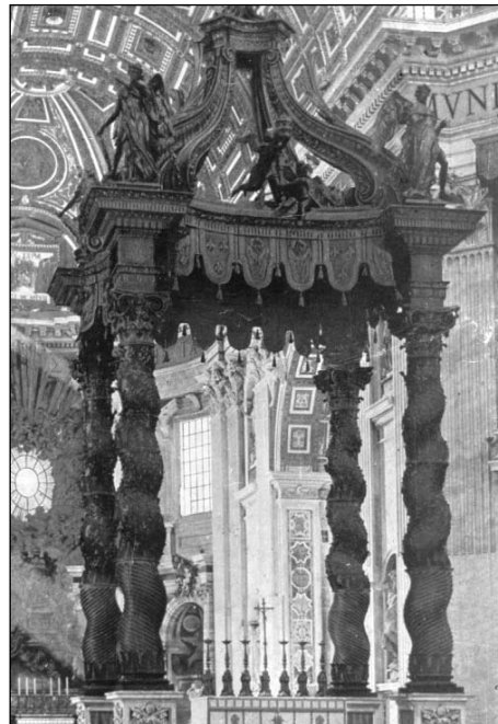
Erroma'ko Kepa Deunaren eleizan "Baldakinoa" edo Errezela: lau age salomonikoak, barrokoaren ezaugarri. Egilea Bernini

rik geienak tankera onetakoak dira. Europa'ko protestanteak asieran aurka jarri ziran baiña azkenean sartu be bai.