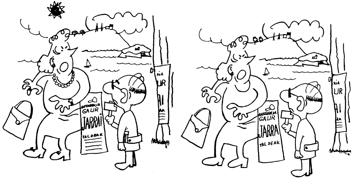
AMAR ERRU AURKITU BEAR DOZUZ!