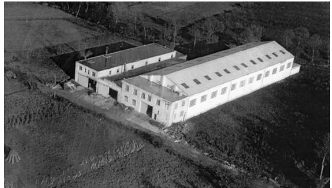
1964. sortu zan urtean.