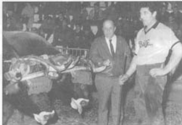
Eri-kirolak eratzan trebea zan, batez be idi-demak.