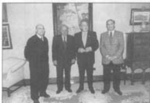
Ardantz Lendakaria'ri esker onez domiña bat eman eutson.