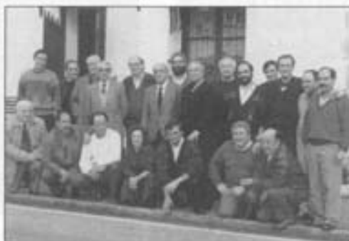
Bizka'ko Batzar Nagusietan (1983-1987)