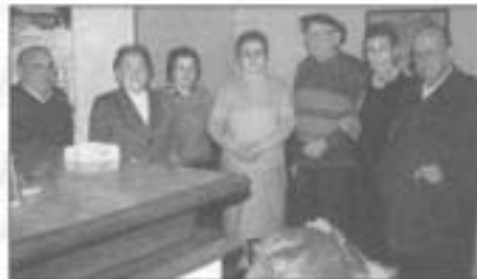
Berriz'ko udaletxeagaz batera gurasoen taldea sortu eban errian.