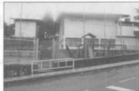
Leareta-Markina ikastetxea sortu eban erriaren laguntzaz. Aldundiak milioi bat.