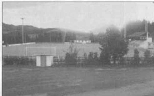
Berrizko futbolaren taldean lenengo lendakaria izan zan.