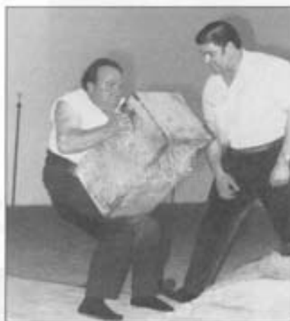
Umore oneko gizona zan. orregaitik postuteren eban erria jailetan: arrijasotzaileak.