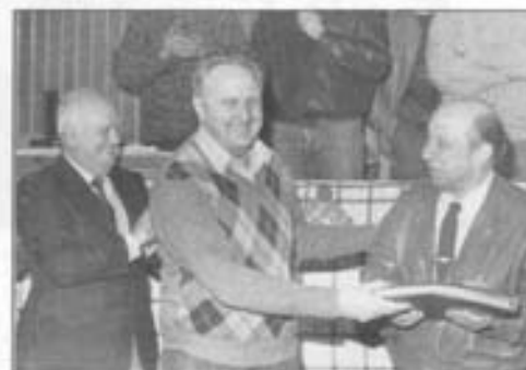
Albiste guztiak zabaitzeko "Munibar" eban lagur