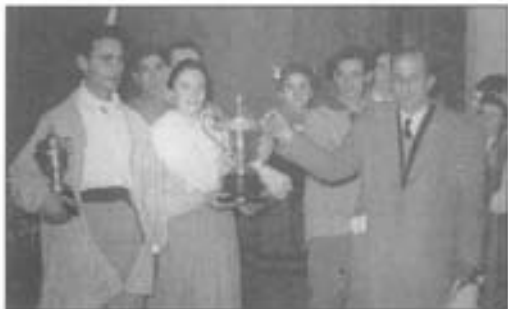
1953n. urtean agertzen da or, sariak banatzen baiña urtero eratzen ebazan sarketak.