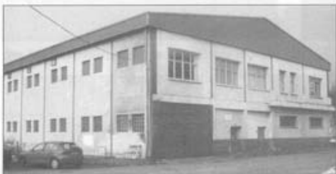
Durango-aldeko atzeratuon alkartea sortu eta aurrera atera eban.