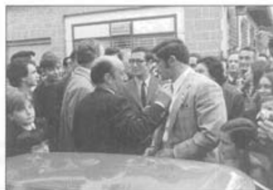
Urtain ikubikari ospetsua be ekarri eban.