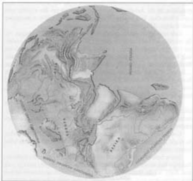
Lur-azalaren alde bat: itxasoak zabalagoak dira. (Eurasia-Afrika)

Itxasoen sailleak lautatik iru dira lur-azal osoan eta legor-une guztiak batu ezker, ez litzakez izango itxaso Barea'ren besteko arloa.