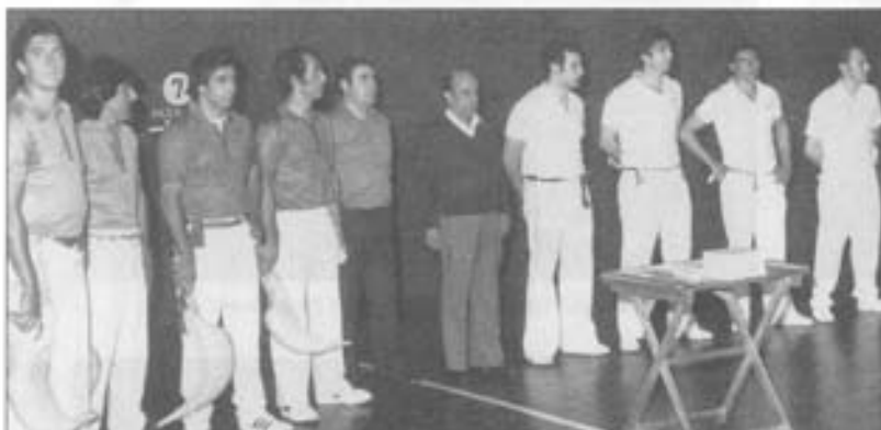
Pelotariak ez ziran inoz peitzen.