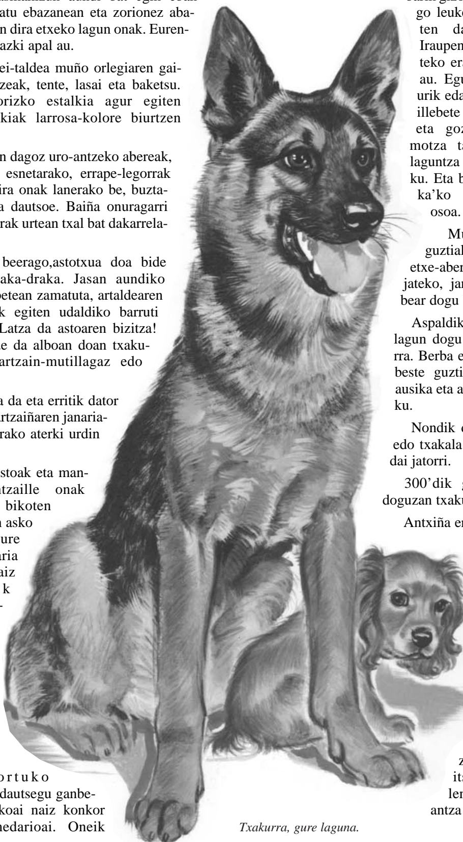
Txakurra, gure laguna.

Basamortuko ontzia esaten dautsegu ganbelu konkori bikoai naiz konkori bateko dromedarioai. Oneik