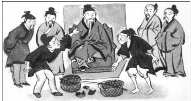
Agureak agintari antxina'ko Txina'n.

Asieran giza-legez bizi ziran bake santuan senitarte aundiak, ildakoak gogoratzen, espiritu etxe-laguntzailleai eta lurrari berari itzaltasuna agertzen, jakiñeko erak eta oikuneak