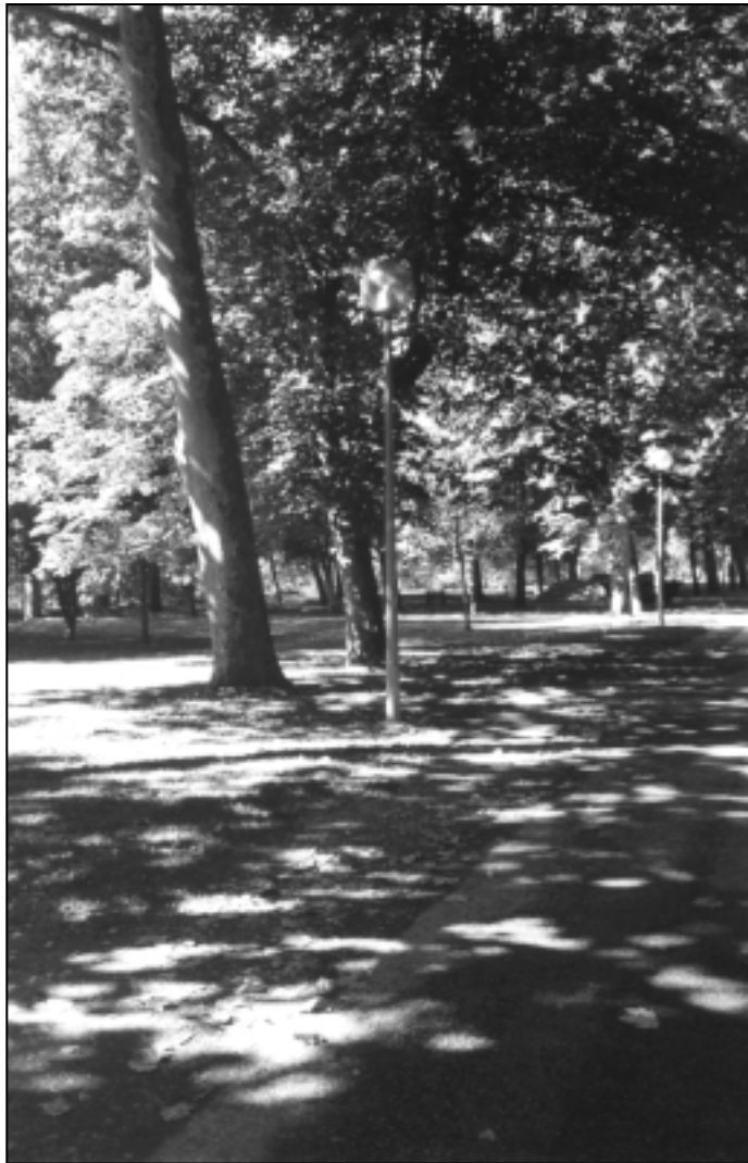
“Los Llanos”. Lizarran.

Ibai au bizpauru zubi azpitik doa ibilli-aldia zabaltzen erriaren inguruan naiko eroso; bertan dago beste lurralde polit bat elizatxo baten azpian, etzanda lasai egoteko