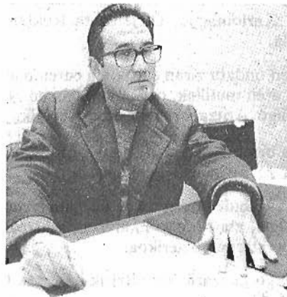
J4 VI LR BAI L_GOOR