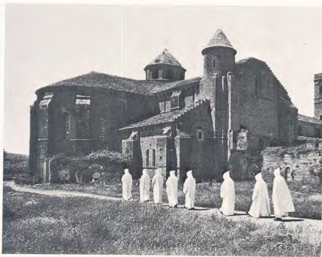
Oliba'ko Lekaide-Etxea Euskalerriaren Bazterrean Naparroa'ren Barruan

BIZKAITARRAI BIZKAIERAZ 32n. ZENBAKIA ORRILLA — 1980 —