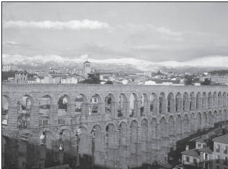
Segobia'ko ur-bidea (Akueduktoa).

Erromatarrek ia dana artu eben Grezia'tik. Eurak gudarako eta legeak egiteko ziran trebeak.