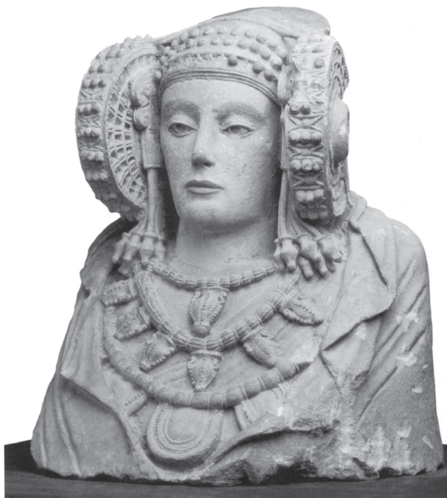
Eltxe'ko anderea (k.a.'k V gizaldikoa). (Iberoak)