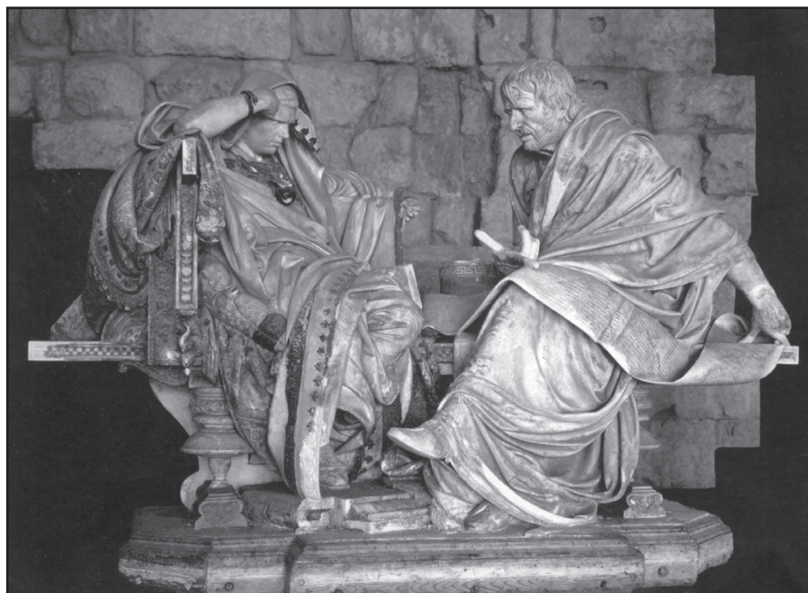
Kalagurri'n Kintiliano'ren oroimenez irudia.