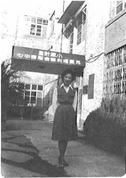
ARTU eizu BETA

Ziur beta zerbait egiteko aldi edo une dogu. Utzi leikena eta bere garaian artun geinkena. Eta: