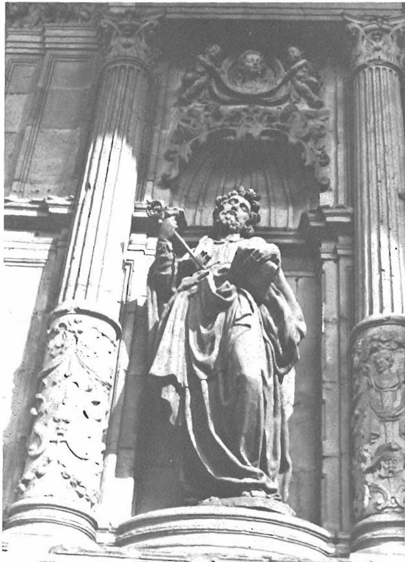
EUSKALDUNEN IRUDIGINTZA BARROKO-TANKERAZ ANTXIETA'K (Kepa D. a , Bilbo'ko San Anton'en)