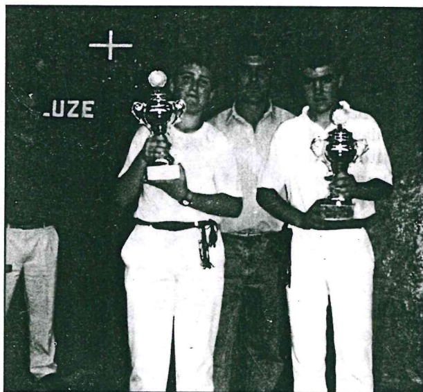
Pelota zaletasuna gazteengan piztu nahian

- Bai, zeozer egin beharko da. Gauzak honela ikusirik eta urrunago joan ez zitezen, Bakioko udaletxea, pelotaka ibiltzen giñenei ziritxoa sartuz, mogitzen hasi giñen. Elkarrizketa hartatik erabaki genbuen pelota "Club" bat sortu beharko zela eta harrezgero pelota munduari dagokion ekimen edo