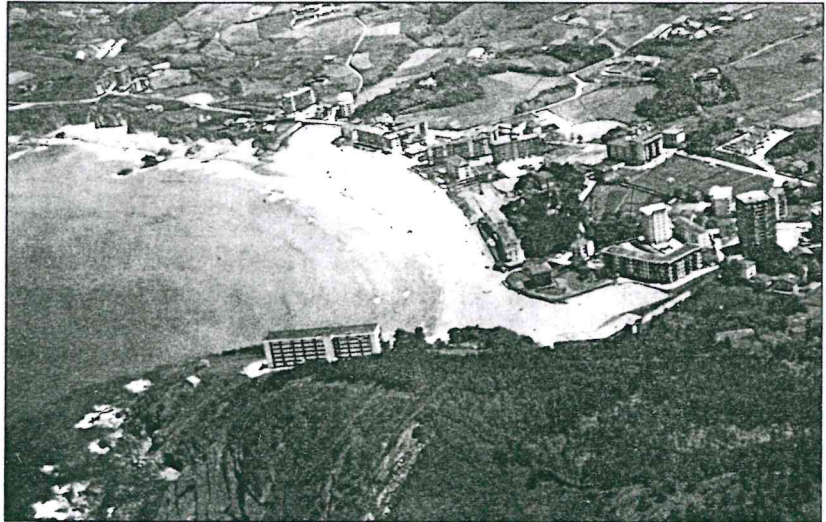
Bakio, duela urte batzu

Ba oraingoan izena eta izana biak alkatzen dira eskutartean dozun aletxo honetan. Zuk holan gura badozu hiru ilabetero-hiru ilabetero agurtuko zaitun aletxo honetan. Baina hemen ez daukat hotsik eta ahalegintxo bat egin beharko dozu nik bizitzen jarraitzea gura badozu hemen dozuzan izkiak batuz, lotuz eta nahastatuz nire txoolen barri izateko.