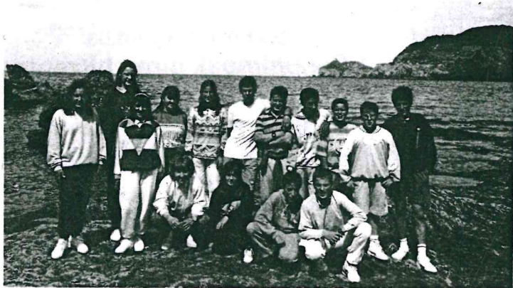
Eskolako 8 o mailako ikasleek etapa berria hasiko dute