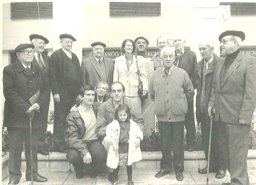
Euskerazaintzako kideekin 1992ko omenaldian Ondarroan.

Zaharrak ia egun osoa eben eta ez beti etxetako maitasunean, inoren menpean eta ardurapean baino, askotan. Lan barik, zeregin barik, minak, kezak, iluntasunak, bakartadeak, urrunggaitzak jo, makurtu eta itzaltzeko bizibiderik egokienean egozan.