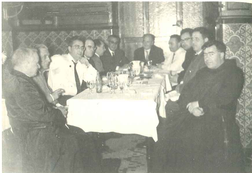
Euskaltzaindiko batzarra. Bilbo, 1963-10-25.

Bilbon sartu orduko, goiz berean, nire egoera garbitu nahi izan neban. Gudari lez uste nintzan eta horrelaxe nire zeregin hori beteterra gertu.