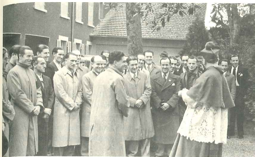
Tarbesko gotzainagaz. 1940ko Pazko Eguncan koroa zuzentzen irudiaren erdian alboz..

Gogoan daukat, hango gizonak, koroan gengozala, gure inguruan, inoiz baino arreta gehiagoz begiratzen euskuela, beharbada guk