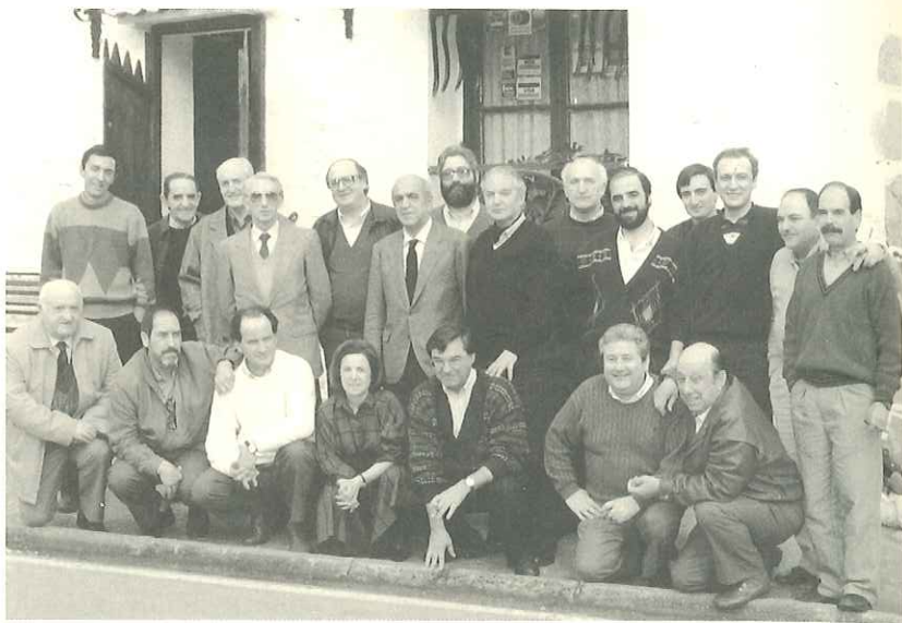
1987ko martiaren 21ean, Bizkaiko Batzar Nagusietako EAJ-PNVko taldekoekin, agintaldi-amaieran.

Handik hiru egunera zuzendariak deitu eta dana bertan behera laga eta atean gertuta ekarren kotxean Balmaseda inguruko Herrerra joateko agindu eustan.