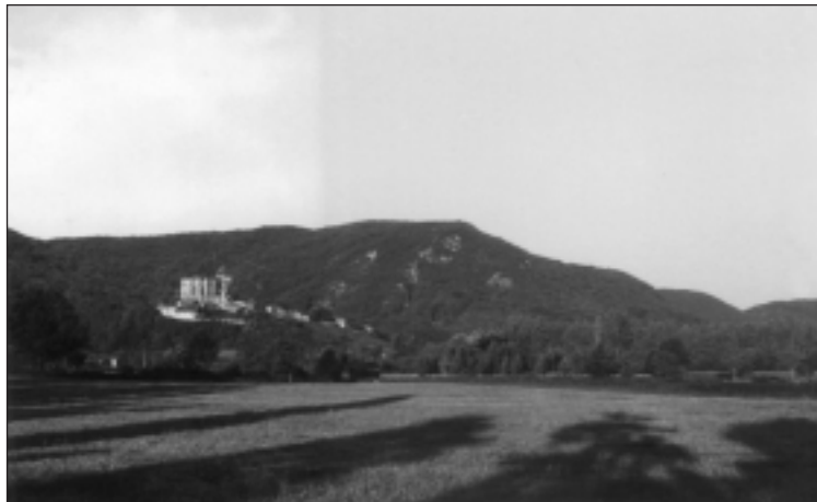
COMMINGES (St. Bertrand) Lugdunum Convenarum Pirine-mendiak