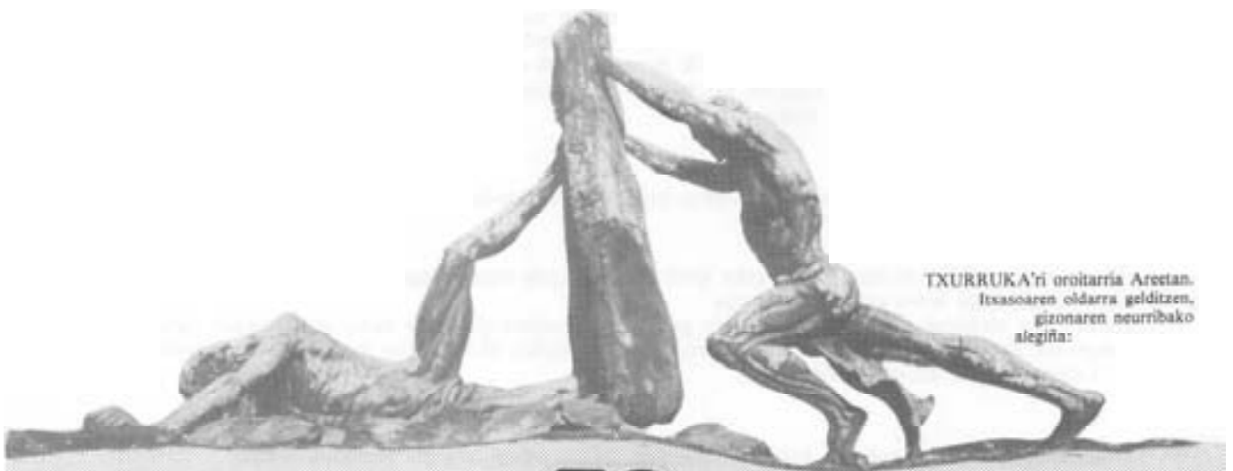
TXURRUKA'ri oroitarría Aretan. Itxasoaren oldarra gelditzen, gizonaren neurribako alegiña: