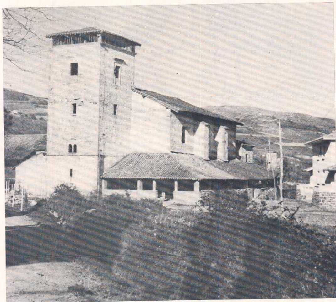
Fruniz ethez banatua fedez alkartua

BIZKAITARRAI BIZKAIERAZ 17 n. ZENBAKIA URTARRILLA -1979-