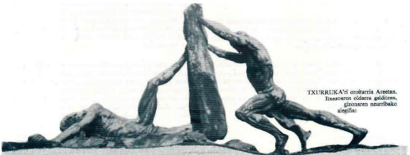
TXURRUKA'ri oroitarria Areetan. Itxasoaren oldarra gelditzen, gizonaren neurribako alegiña: