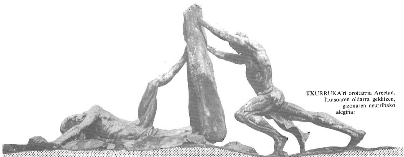
TXURRUKA'ri oroitarria Areetan. Itxasoaren oldarra gelditzen, gizonaren neurribako alegiña: