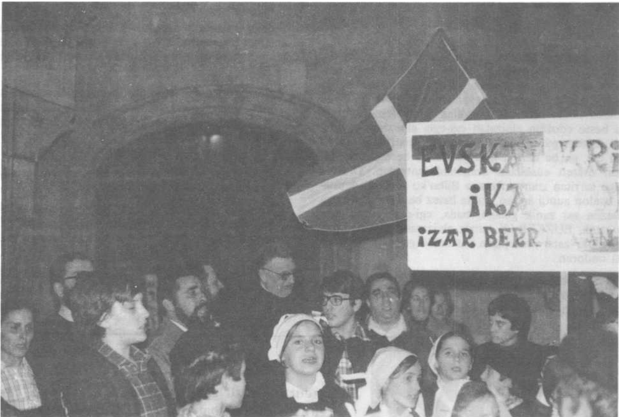
D. Klaudio'k benetan maite eban euskalerra.

— Amaitzeko auxe; eskerrak zor deusadaz Jaungoikoari gizon andi au ezagutu nebalako, abade zintzoa, euskerazale eta abertzale andia; buruz argia, biotzez ona eta esku-zabala.