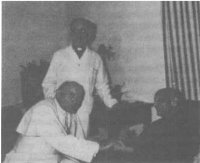
Aita Arrupe S.J.: Aita Santuaren ikustaldia gaisotegian.

Aurtengo zezeillaren 5'ean il zan Erroma'n Aita Arrupe Josu-Lagunen ogei ta zazpigarren Nagusia, gaiso luze batek amar urtetan Erroma'ko Josu-lagunen gaisotegian euki ondoren.