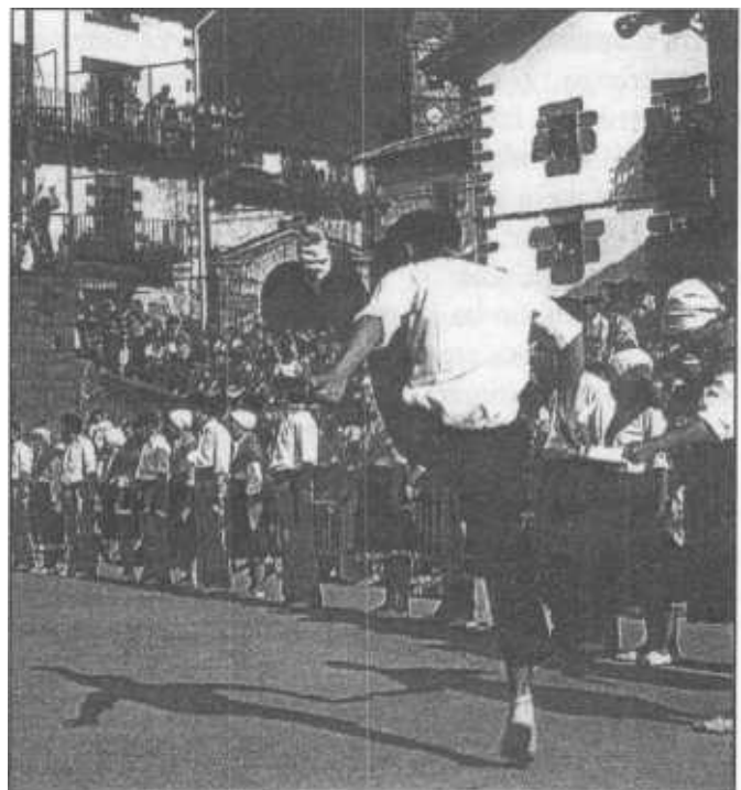
Sokaren aurrendaria eta azkendaria, Leitzako plazan, Ingurutxuan dantzaten.