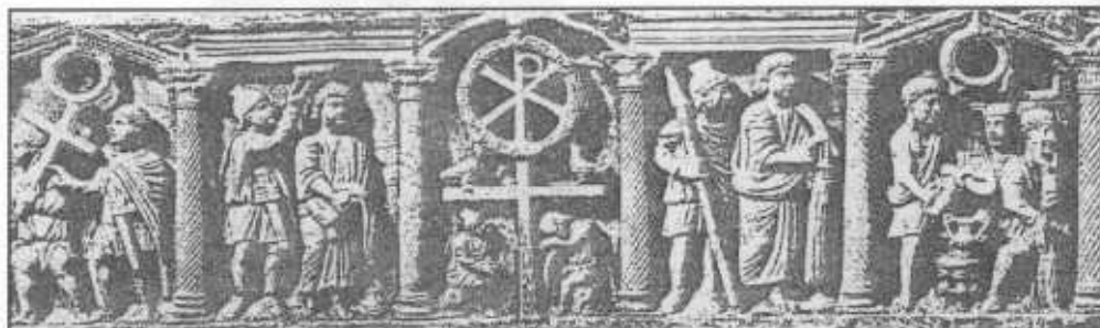
IL-KAJA BAT Erroma'n.