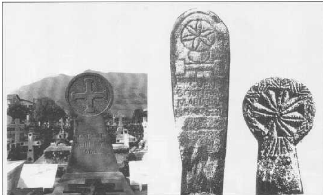
SARA'ko ILLERRIA – "GAR-ate". IL ARRIAK