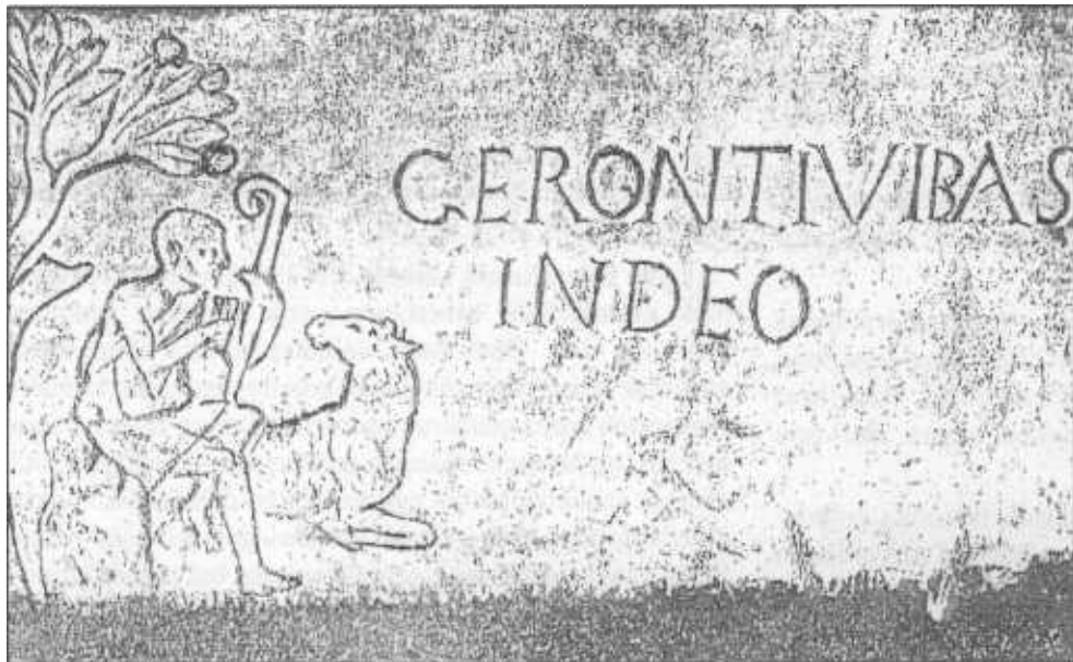
Erroma'ko katakunbak: Illobi bateko itzak.

TACCHI VENTURI, Pedro, "Historia de las Religiosas" T.II. Gustavo Gili S.S. Barcelona 1947, 163 orrialdean (eta ondorengoetan) onela dio: