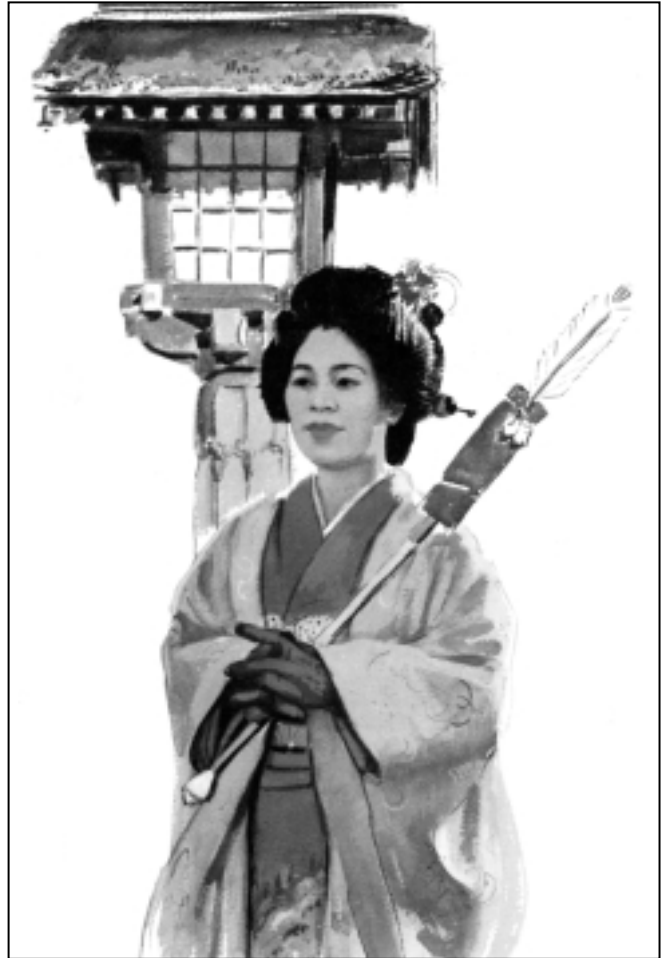
Japondar emakume bat, «deabruak uxatzeko» geza eskuan.

Aztikerietan asko sartzen da Kit-tsu-ne dertxon piztia eta ipuin asko dagoz orreri begira. Azkonarrak ibiltariak