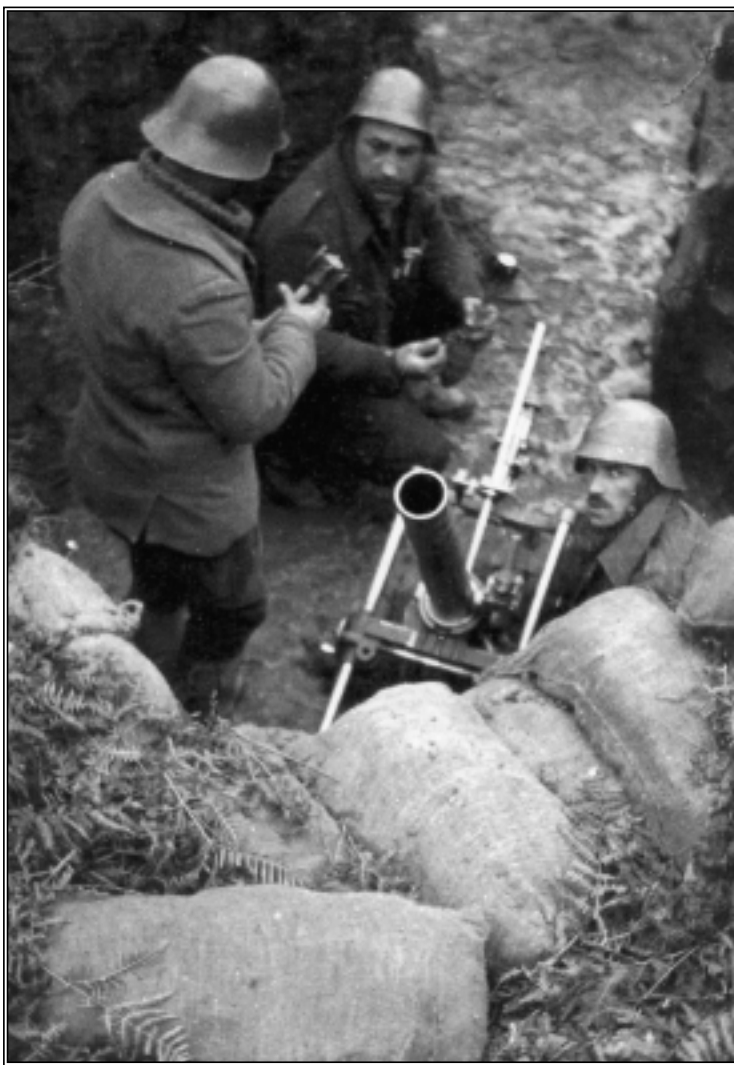
Otxandio-Legutiano: gudariak gertaketan.

Bere edestian EAJ/PNV'k artu dauan erabagirik aundiena, erkalalaren alde gudara sartzea izan zan. Jakiñak dira gure aldun euskaldunak Erroma'n kontzientziko arazo lez ori aurkeztu ebenean, artu eben erantzun maltzurra: «Moral aldetik ondo zoaze, baiña galdu egingo dozu».