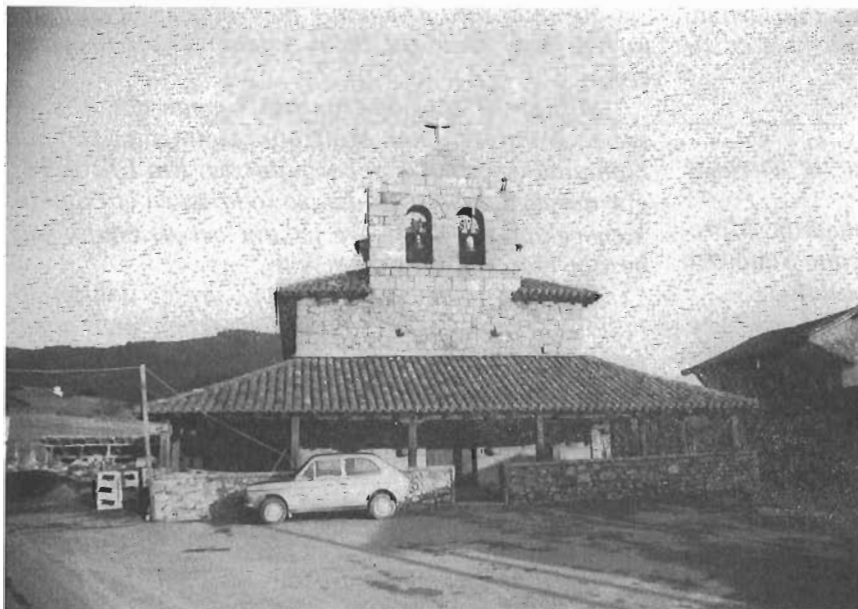
DUDEA'KO MIKEL DEUNA.

Karlatarren Gernika'ko batalloia ta Ayastuy'ren nabaritu ziran.