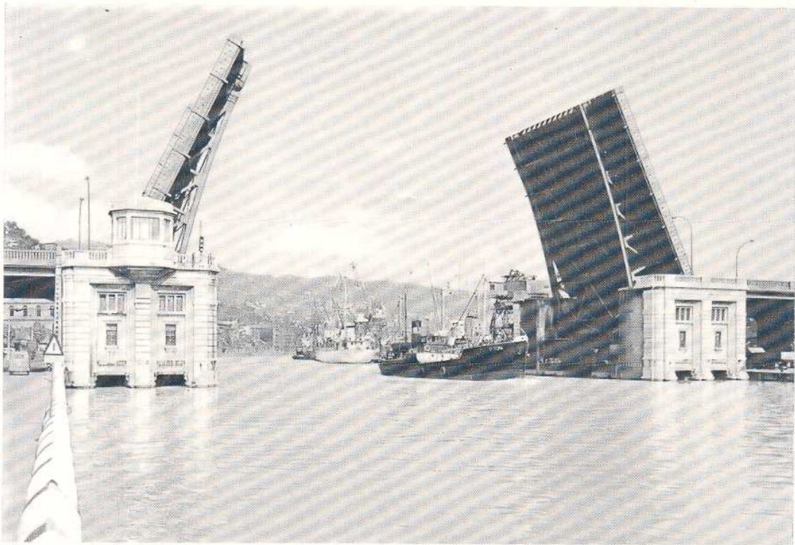
BILBO'KO ATEAK MUNDU GUZTIRA BIDEAK