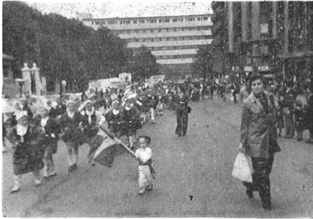
KILI-KILI'TARRAK BILBO'N (1977-X-9)