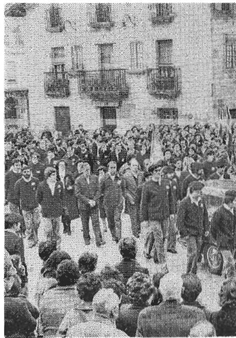
LAUAXETA GIZON, KRISTIÑAU, (Olerkariaren azurral.

«Zergaitik eztozak euskeraz egiten?, itanduten deutso Ibiñagabeitiak.