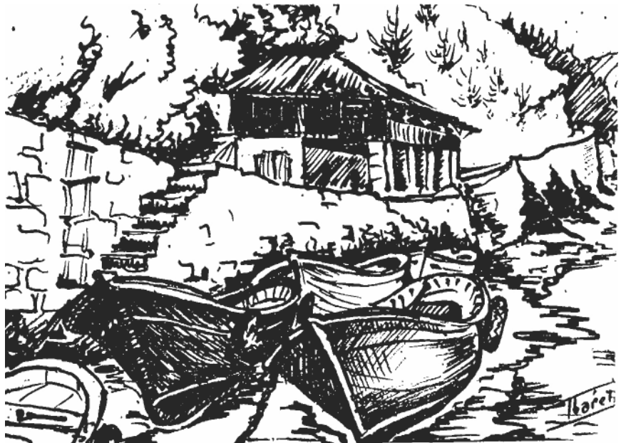
IBARRETXE MARRALARIAK ONELAN IKUSI EBAN EA