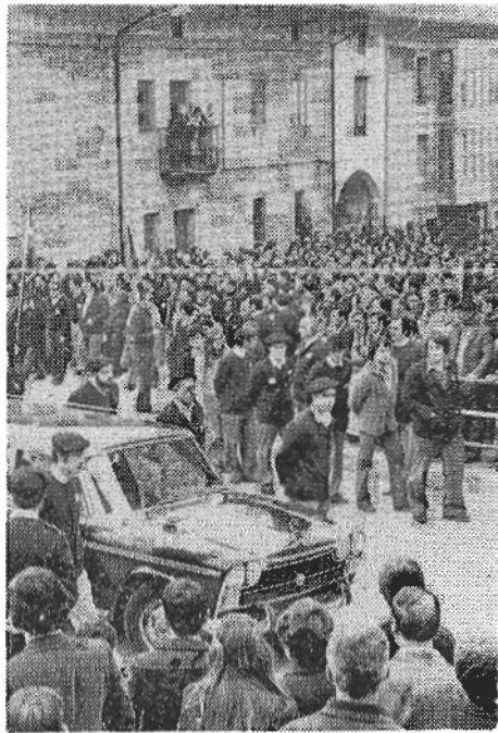
SKALDUN TA KANTARI IL ZAN [ungia'ko illerrira)

Gizon, kristiñau euskaldun eta kantari ii zan Lauaxeta. Orain, olerkariaren azurrak Mungiako kanpo santura, illerrira, eroandakoan, ez al dabe aren azken-naia bete berik itxiko. Kristoren gurutzearen itzalak zainduko al dituz azurrok «Errien Egun Aundira arte».